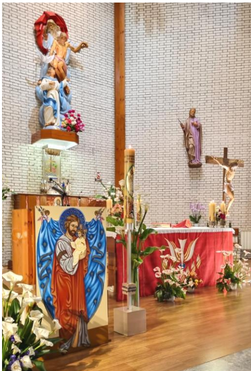
Iglesia del Monasterio de Monjas Concepcionistas de Alcázar de San Juan

“El divino Espíritu es santidad y no pacta con el pecado; es amor y no conexiona con el egoísmo; es luz y no se aviene con las tinieblas del error; es fecundidad y calor y no se puede juntar con la fría esterilidad del mal”.